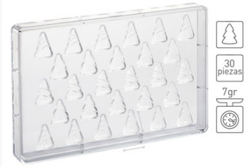
3,1 x 2,2 cm H: 2,2 cm